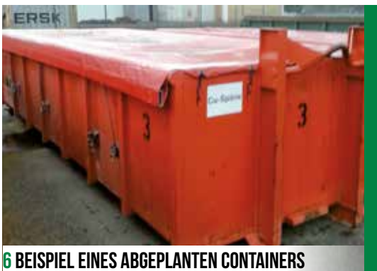
6 BEISPIEL EINES ABGEPLANTEN CONTAINERS

Abhängig von der Vertragsgestaltung zwischen Entfallstelle und Entsorger ist sicherzustellen, dass die Späne je nach Beschaffenheit während des Sammelprozesses keinem Niederschlagswasser ausgesetzt sind. Hierzu sollten je nach Standort und Möglichkeit des Unternehmens geeignete Maßnahmen wie Überdachungen oder Abdeckungen der Behälter vorgenommen werden (z. B. gedeckelte oder abgeplante Container/Mulden).