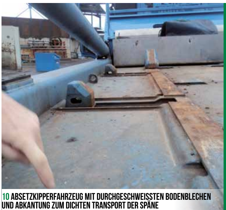
10 ABSETZKIPPERFAHRZEUG MIT DURCHGESCHWEISSTEN BODENBLECHEN UND ABKANTUNG ZUM DICHTEN TRANSPORT DER SPÄNE

Um chemische Reaktionen (z. B. Oxidation) zu vermeiden, die insbesondere bei sehr feinen Spänen auftreten können, ist es unbedingt erforderlich, unterschiedlich nach AVV eingestufte Spänesorten ab ihrem Entfall über die Lagerhaltung bis hin zum Versand getrennt zu halten, z. B. Messingspäne, Magnesiumspäne. Auch zur Gewährleistung einer qualitativ hochwertigen Verwertung sollten die verschiedenen Spänesorten ggf. ab ihrem Entfall über die Lagerhaltung bis hin zum Versand getrennt gehalten werden.