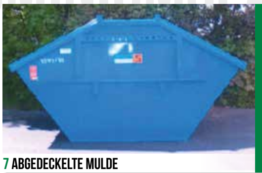
7 ABGEDECKELTE MULDE

Folgende Beispiele stellen ihre Praxistauglichkeit täglich unter Beweis: