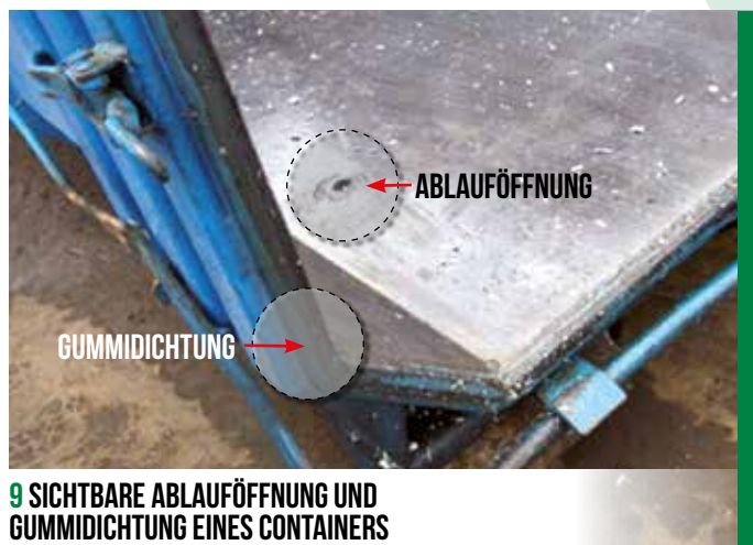
9 SICHTBARE ABLAUFÖFFNUNG UND GUMMIDICHTUNG EINES CONTAINERS

Die Gummidichtungen sind Verschleißteile und daher gegebenenfalls (siehe Bild 9) auszutauschen.