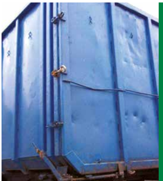
8 SPEZIELLER SPÄNETRANSPORTCONTAINER

Zusätzlich gibt es eine Seitenverriegelung, damit die Tür nicht aufspringen kann, wenn die drei Schrauben seitlich gelöst werden.