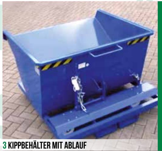
3 KIPPBEHÄLTER MIT ABLAUF