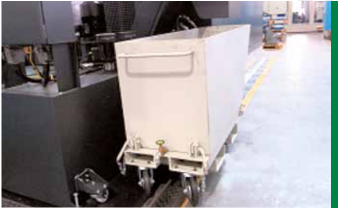
1 KIPPBARER AUFFANGBEHÄLTER MIT AUSLAUF

Die Vielfalt der anfallenden Späne erfordert bei der Erfassung, insbesondere wegen der unterschiedlichen Feuchtigkeitsgehalte, entsprechend angepasste Methoden. Diese orientieren sich außerdem an der Menge der anfallenden Späne in einem Unternehmen (vgl. hierzu auch Kapitel 4.3).