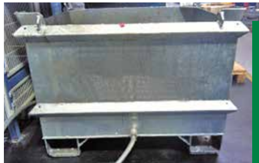
4 AUFFANGCONTAINER MIT DOPPELWANDIGEM BODEN, SPÄNESIEB UND ABLAUVORRICHTUNG FÜR EMULSIONEN

Für das Auffangen der Späne am Ort der Entstehung können beispielsweise Kippbehälter zum Einsatz kommen, die in jeder Größe erhältlich und mit einem Ablaufhahn oder einer Schlauchverbindung zur Rückführung von Emulsionen oder Schneidölen ausgestattet sind, siehe Bild 1 - 4. Es ist verstärkt auf die Dichtigkeit der Container zu achten. Die Doppelwandigkeit des Behälterbodens kann hier unterstützend wirken.